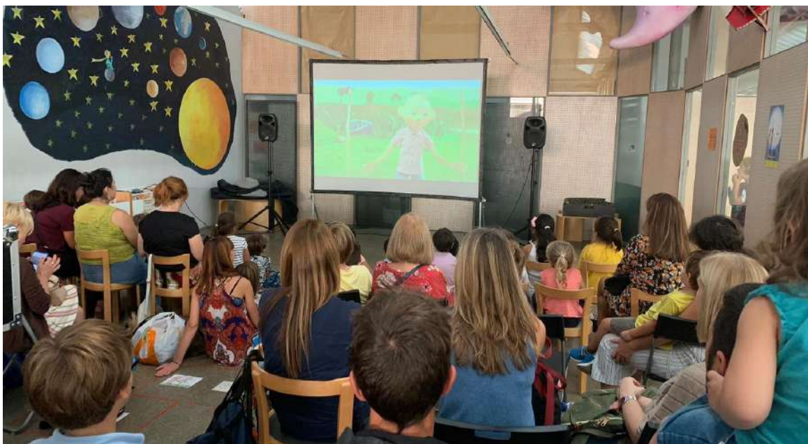
Biblioteca Can Casacuberta

Per aquells nens i nenes que encara no fan primer de Primària, FILMETS també ha preparat tot un seguit de projeccions. Es tracta de les sessions anomenades FILMETS a les Biblioteques, que es faran a tot Badalona. Durant uns dies, la tradicional 'Hora del conte' es transforma en l'hora del cinema. Són sessions de curmetratges infantils que ofereixen cinema de qualitat a infants acompanyats de les seves famílies. Les biblioteques de Badalona que hi participen són Can Casacuberta, Lloreda, Pomar, Sant Roc, Llefia-Xavier Soto, i Canyadó-Casagemes-Joan Argenté.