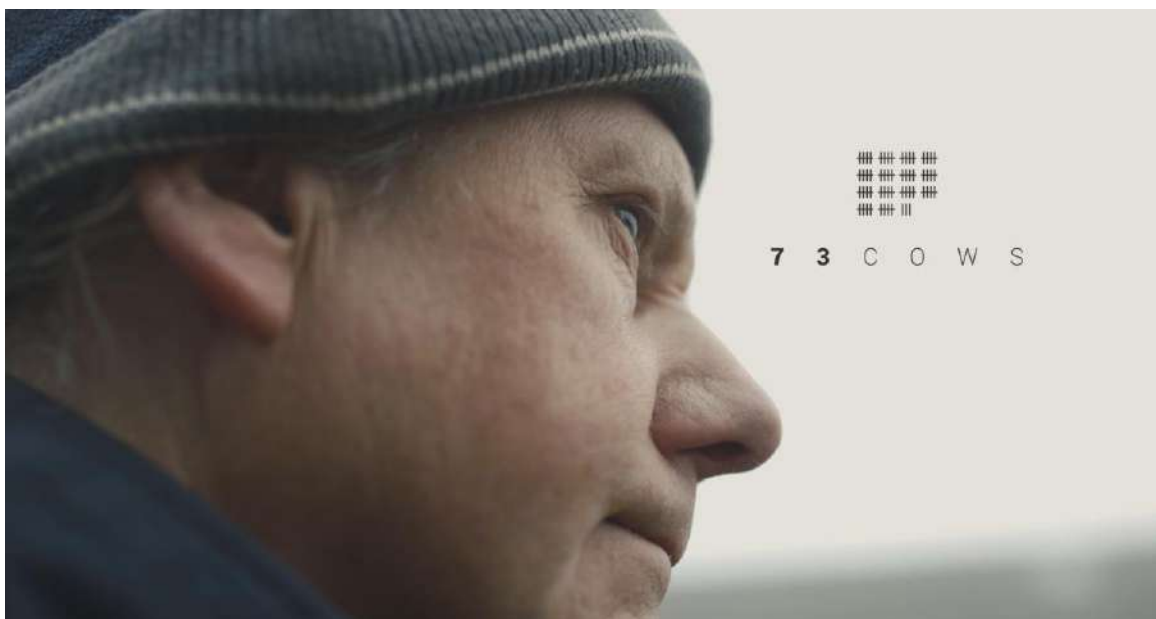
73 Cows d'Alex Lockwood

Els sis curts també nominats als premis BAFTA 2019, que per tant van ser finalistes, i que es podran veure a la pantalla del Teatre Zorrilla són: Bachelor , 38 ; The Blue Door ; The Field ; Wale ; I'm OK ; Marfa