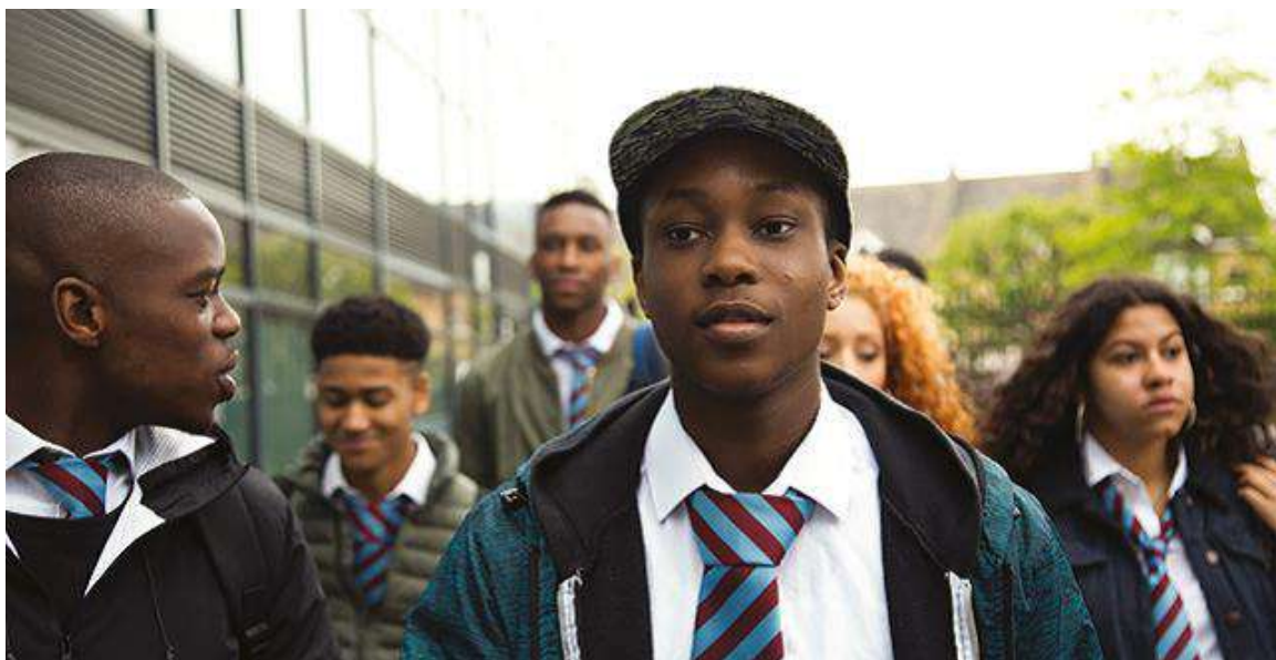
We Love Moses

We Love Moses , Strings ; Jamie ; I am a women ; Take your partnes ; Where are we now ; Crush ; Balcony ; i Chance .