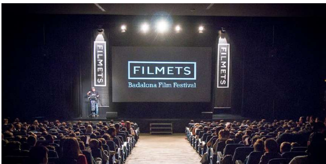
Teatre Blas Infante de Badalona

Amb el nom de 'FILMETS Primària' i 'FILMETS Secundària', el Teatre Blas Infante, ubicat al barri de Llefia de Badalona, acollirà cada dia feiner mentre duri el festival, de 10 a 13 hores, les projeccions per a estudiants de 3r de Primària (8 anys) i de 4rt d'ESO (15 anys). El mateix succeirà als cinemes Can Castellet de Sant Boi de Llobregat el dimarts 22 a les 11 hores per a alumnes de Primària i el dimecres 23 a les 11 hores per a alumnes de Secundària.