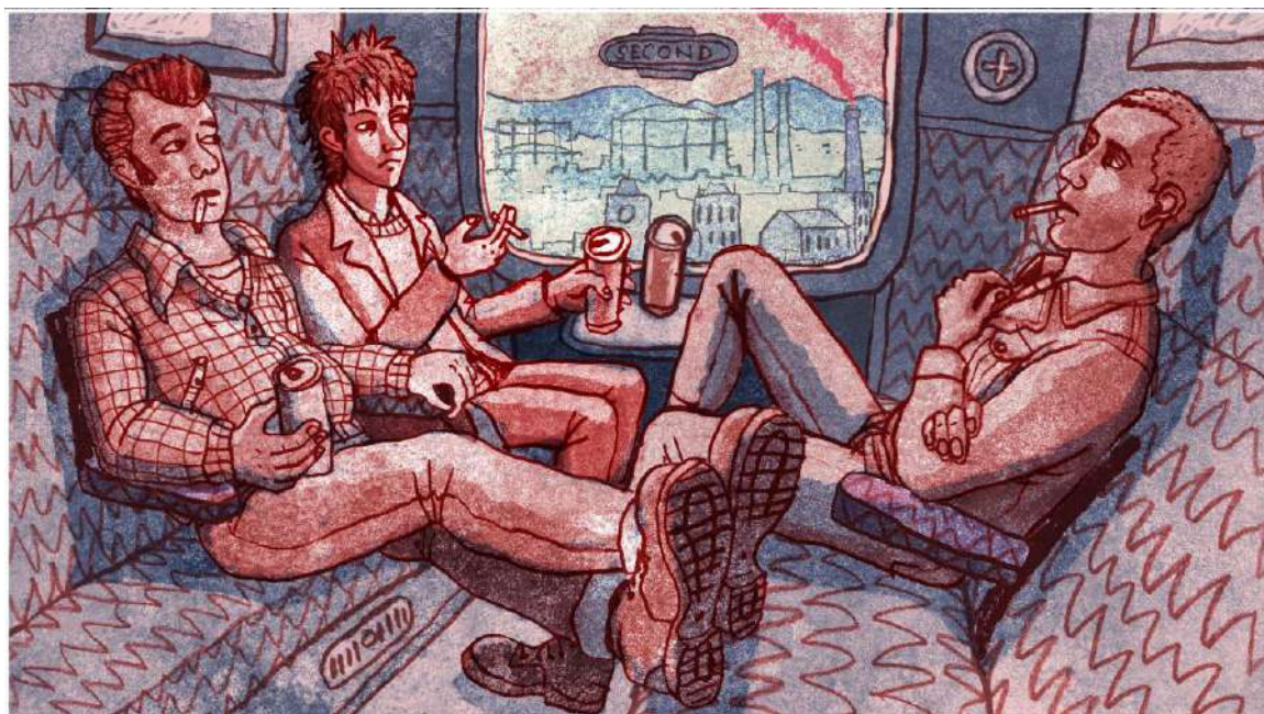
Roughhouse de Jonathan Hodgson