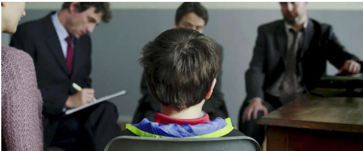
Detainment de Vincent Lambe

Detainment és la dura crònica basada en transcripcions d'entrevistes i gravacions fidedignes del cas James Bulger, que va commocionar el món l'any 1993 en tractar-se de l'assassinat d'un nen de 2 anys a mans d'altres dos infants a la localitat anglesa de Merseyside.