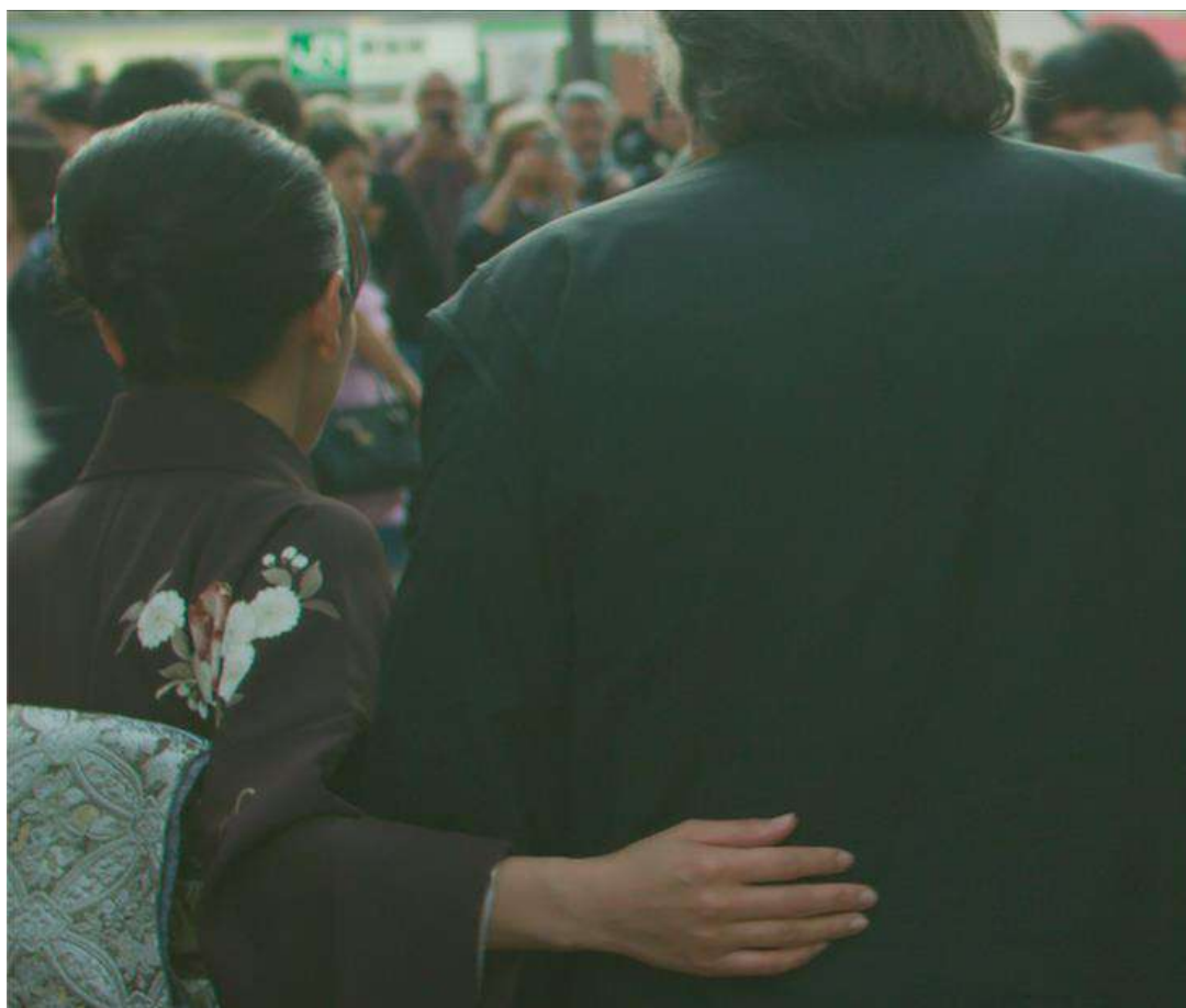
Grenouille de cristal de Slony Sow

Gérard Depardieu serà a FILMETS Badalona Film Festival. Si més no a la pantalla del Teatre Zorrilla de Badalona. Els espectadors del festival podran veure la seva imponent actuació en el curt Grenouille de cristal , que es podrà veure en la sessió de cloenda del festival que es farà divendres 25, a les 21 hores.