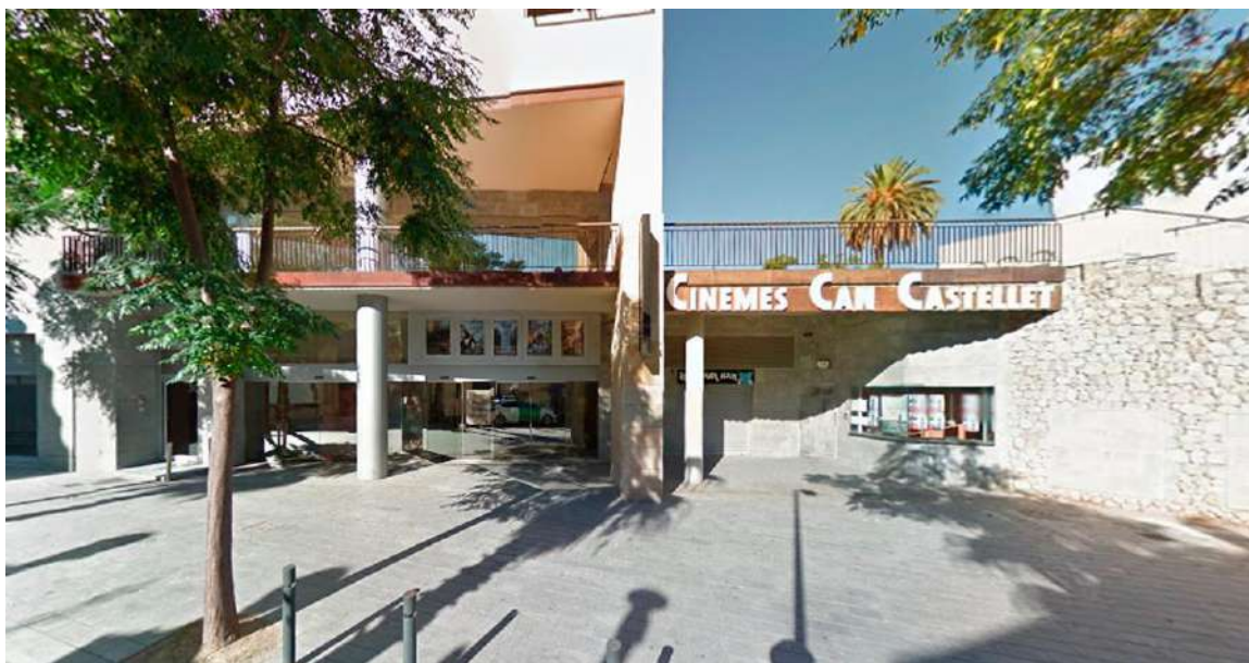
Cinemes Can Castellet