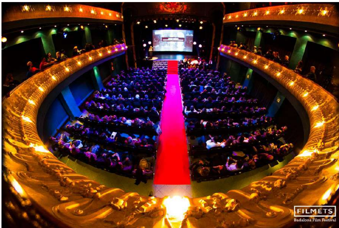
Teatre Zorrilla de Badalona

Finalment, FILMETS acollirà la preestrena del documental Lesbos. Una illa que espera , una producció de Badalona Comunicació amb el suport de l'Àrea Metropolitana de Barcelona i la Diputació de Barcelona. Es tracta d'un projecte que vol copsar la realitat de l'illa grega de Lesbos i el camp de refugiats de Moria on hi malviuen milers de persones. Es podrà veure divendres 18 d'octubre, a les 19 hores, al Teatre Zorrilla de Badalona.