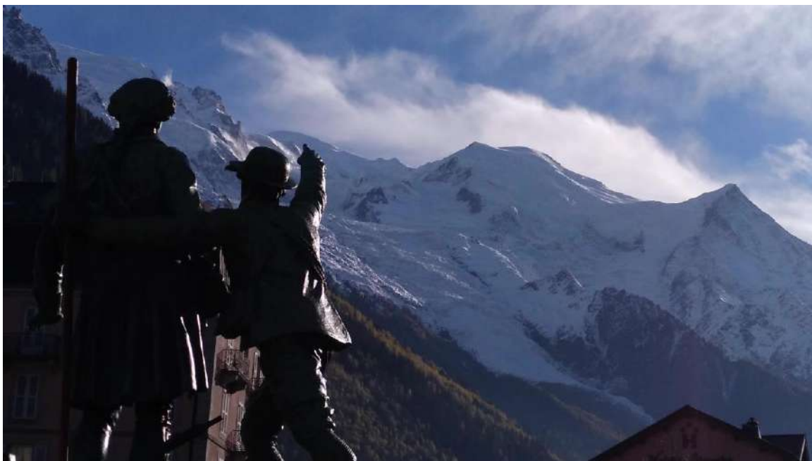
Un repte anomenat Mont Blanc