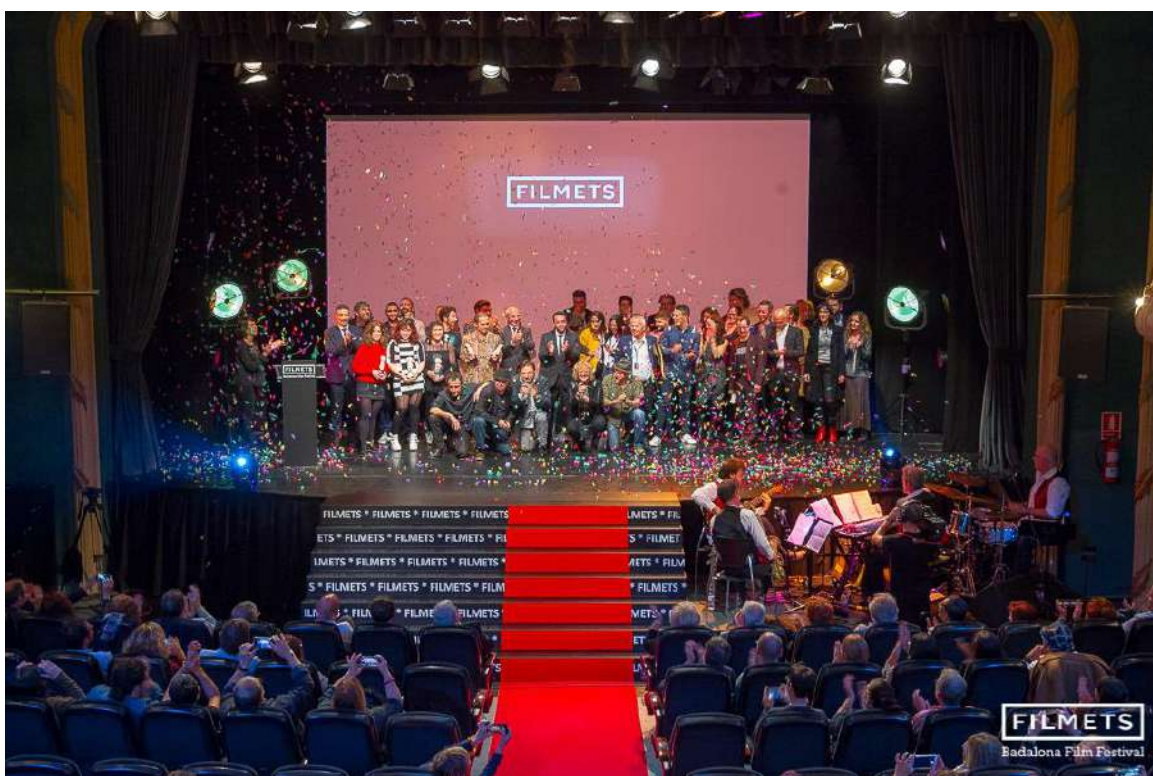
Foto de família 2018

El Jurat Oficial Internacional i el Comitè Organitzador podran atorgar els premis especials que considerin oportuns no previstos a les bases.