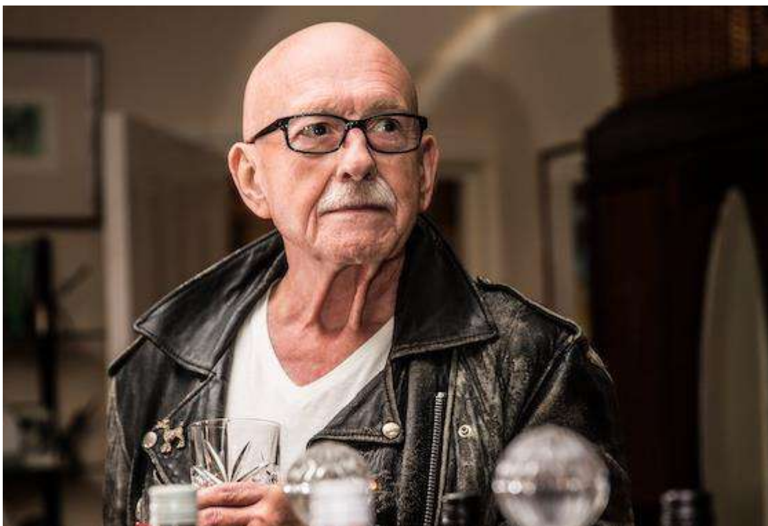
Bachelor, 38 d' Angela Clarke

Posteriorment es projectaran els altres 6 curts finalistes en aquesta edició dels premis BAFTA 2019: Bachelor , 3 , The Blue Door , The Field , Wale , I'm OK i Marfa .