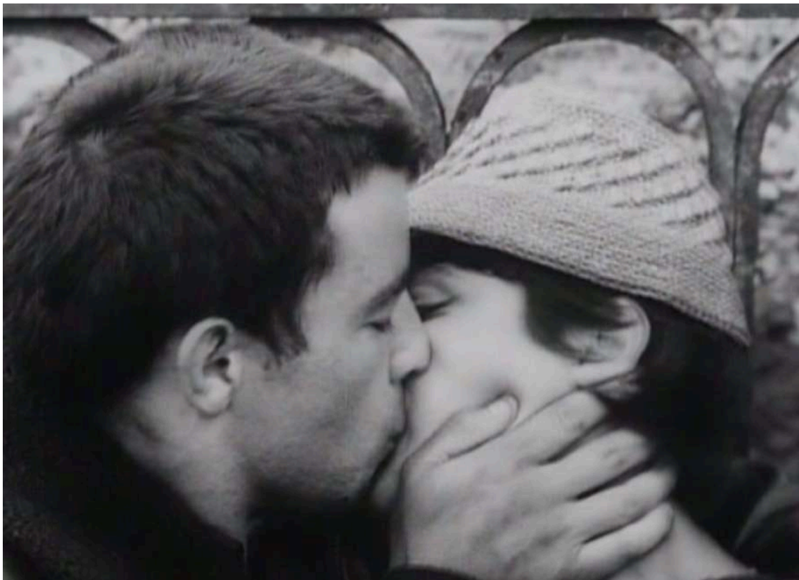
Les mistons de François Truffaut

Durant la sessió Vivement Truffaut es retrà homenatge a Unifrance, amb motiu dels 70 anys de la seva creació. Unifrance és la gran empresa pública francesa que té com a missió la promoció i exportació de pel·lícules arreu del món.