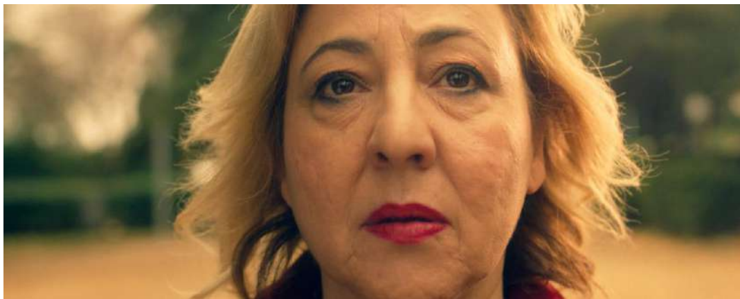
¿Por qué miente la gente?