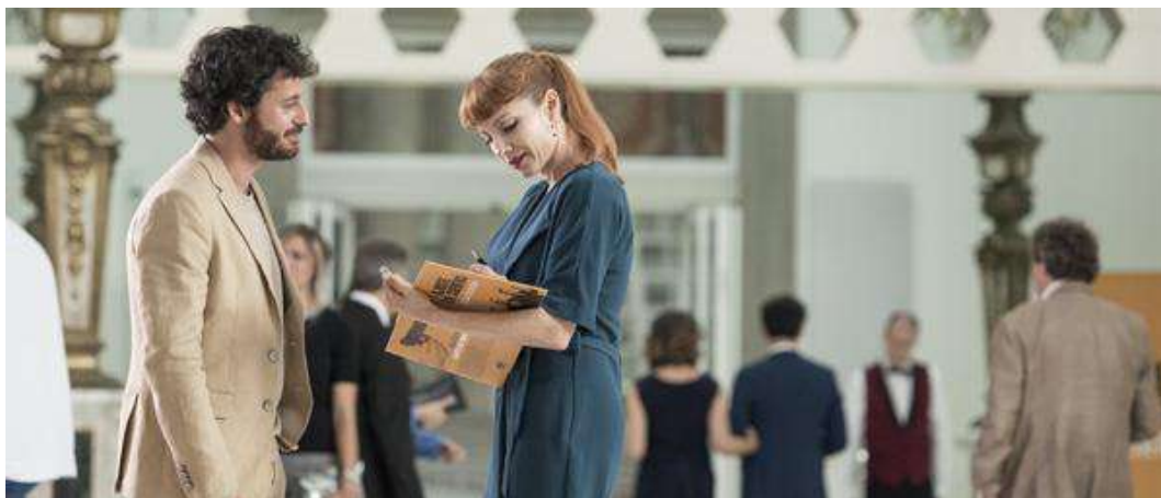
La octava dimensió