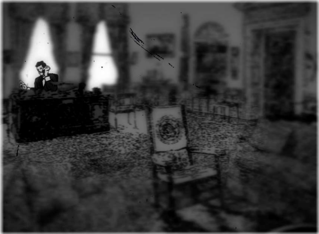
JFK vs THE AIR FORCE de Sandro Toth