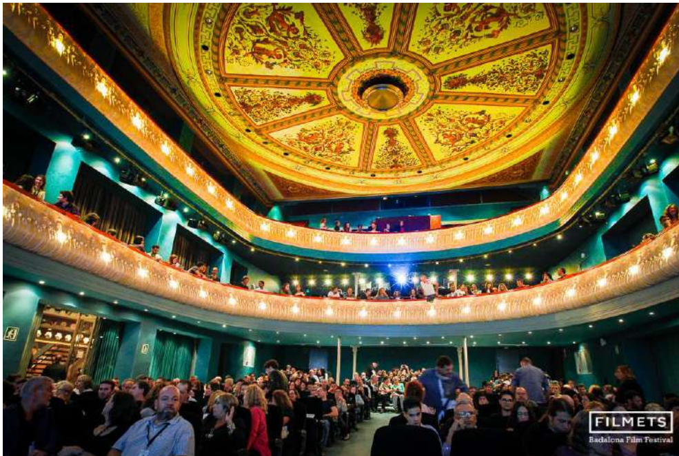
Teatro Zorrilla de Badalona

Todas las sesiones son de entrada libre y gratuita, excepto la Gala de Clausura de FILMETS: La Nit de les Venus, que es por invitación. En algunas sesiones, pese a ser la entrada gratuita, habrá que inscribirse previamente en la web del festival.