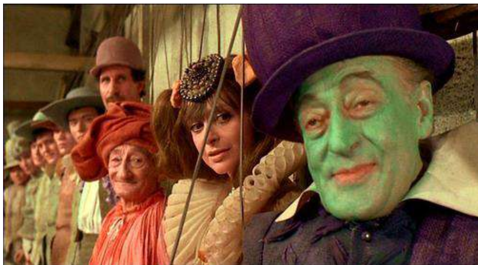
'Che Cosa Sono Le Nuvole'

Esta sesión cuenta con el apoyo y la colaboración del Consulado de Italia y de l'Istituto Italiano di Cultura.