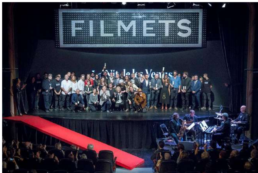
Foto de familia 2017

El Jurado Oficial Internacional y el Comité Organizador podrán otorgar los premios especiales que consideren oportunos no previstos en las bases.