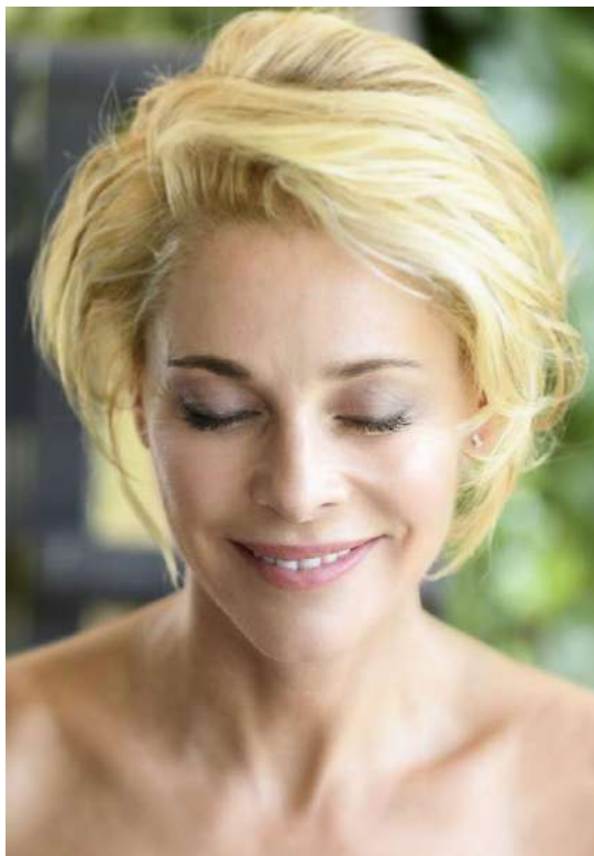
'El Atasco' con Belén Rueda

Así pues, en las pantallas del Teatro Zorrilla se proyectarán cortos que tienen como protagonistas a Belén Rueda, Marcel Borràs, Macarena Gómez, Cristina Brondo, Bruna Cusí, Catherine Deneuve, Nausicaa Bonnín, Javier Gurruchaga y Maria Grazia Cucinotta, entre muchos otros.