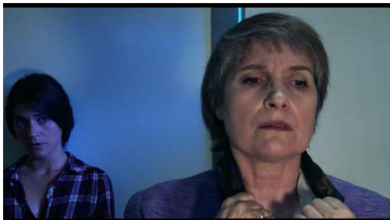
'Donde no puedes llegar'