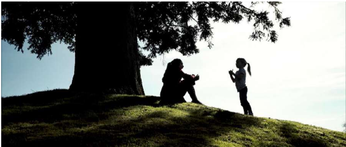
'The Silent Child'

Un cortometraje de lujo que dejó maravillados a los miembros de la Academia de Hollywood y que marca el punto de inicio de la 44.ª edición de FILMETS